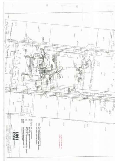
Rysunek 1_PZT projekt wykonawczy