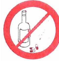
Napoje alkoholowe, narkotyki