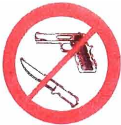
Broń, materiały wybuchowe, noże