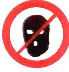
Części ubioru zakrywające twarz, kominiki

PRZEWODNICZĄCY Rady Miejskiej w Łomiankach