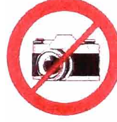
Profesjonalne aparaty fotograficzne, kamery