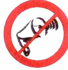
Megafony, syreny, inne urządzenia emitujące dźwięk