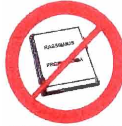
Materiały rasistowskie, ksenofobiczne, polityki religijne, propagandowe