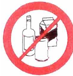
Butelki, puszki, kubki, dzbanki