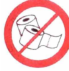
Duże ilości papieru