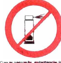
Gaz w aerozolu, substancje żrące, łatwopalne, barwniki