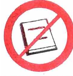
Przedmioty, materiały, ubrania komercyjne i promocyjne