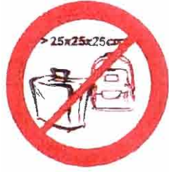
Pudła, torby, plecaki, walizki i inne wszelkie przedmioty większe niż 25 cm x 25 cm x 25 cm