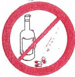
Napoje alkoholowe, narkotyki