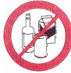
Butelki, guszel, kubki, dzbanki