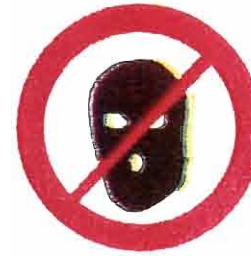
Części ubioru zakrywające twarz, kaptury