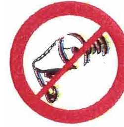
Megafony, syreny, inne urządzenia emitujące dźwięk