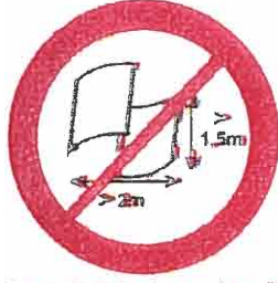
Banery lub flagi o wymiarach wysokościach niż 2,0 m. x 1,5 m.