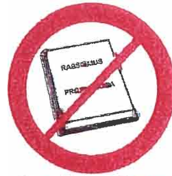
Materiały rasistowskie, ksenofobiczne, polityczne, religijne, propagandowe