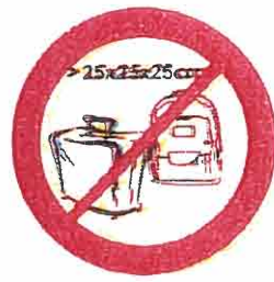
Paczka, torby, plecak, walizki i inne wszelkie przedmioty większe niż 25 cm x 25 cm x 25 cm