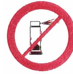
Gasz w aerozolu, substancje żrące, łatwopalne, barwniki