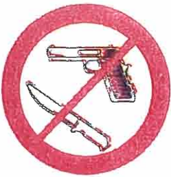
Broń, materiały wybuchowe, noże