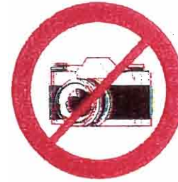
Profesjonalne aparaty fotograficzne, kamery