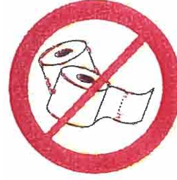
Duża ilość papieru