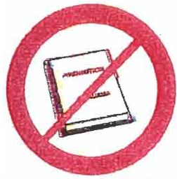
Przedmioty, materiały, ubrania reklamowe i promocyjne