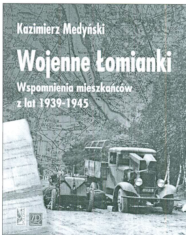
Projekt okładki nowego wydania książki