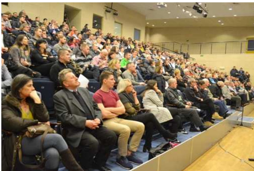
Zdjęcie 2. Mieszkańcy gminy Łomianki uczestniczący w konsultacjach społecznych

Na początku spotkania Zastępca Burmistrza Łomianek przedstawił ogólne uwarunkowania związane z realizacją planowanej małej obwodnicy Łomianek, do których należały obowiązujące akty prawa miejscowego, tj. Miejscowe Plany Zagospodarowania Przestrzennego, dokumenty planistyczne oraz krótką historię koncepcji przebiegu trasy obwodnicy od 2002 r.