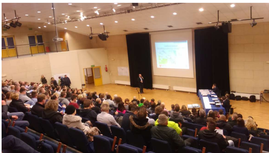
Zdjęcie 1. Przedstawiciel firmy Vegmar prezentujący koncepcję małej obwodnicy Łomianek.

ostatecznie do dalszych prac zarekomendowano przebieg trasy na odcinku od skrzyżowania nr 1 do skrzyżowania nr 8 zgodnie z wariantem 1, skrzyżowania 8 i 9 rozwiązać zgodnie z wariantem 2, a odcinek od skrzyżowania nr 9 do końca opracowania do końca zgodnie z wariantem nr 4.