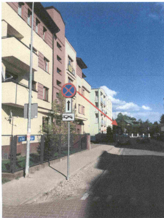
2. Propozycja rozwiązania nr 1