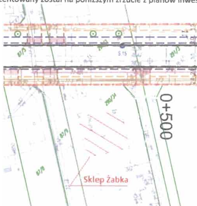
Rys 1. Brak zjazdów do punktów usługowych - sklep Żabka

Doskonałym przykładem obrazującym niedogodności, jakie wygeneruje ścieżka rowerowa poprowadzona po obu stronach Al. Chopina, jest brak zjazdu do jedyne sklepu spożywczo przemysłowego zlokalizowanego na Alei Chopina (i chyba jedyne w Łomiankach Dolnych) - przykład zaprezentowany został na poniższym zrzucie z planów inwestycyjnych.