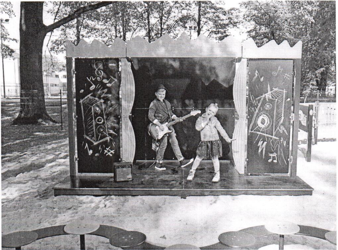
NIVEA PLAC ZABAW1346.jpg