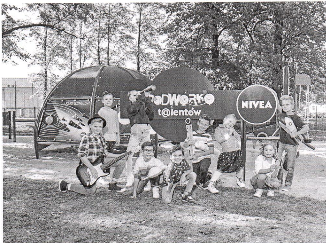
NIVEA PLAC ZABAW0639.jpg