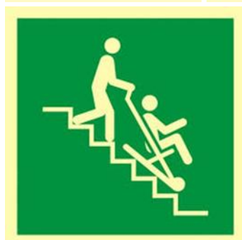
OZNACZENIE MIEJSCA Z KRZESŁEM EWAKUACYJNYM