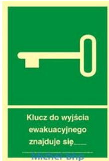
OZNACZENIE GDZIE ZNAJDUJE SIĘ KLUCZ