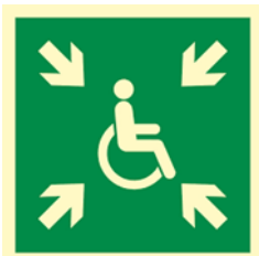
PUNKT ZBIÓRKI OSÓB Z NIEPEŁNOSPRAWNOŚCIAMI