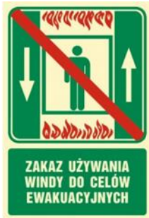
ZAKAZ UŻYWANIA WINDY W CZASIE POŻARU