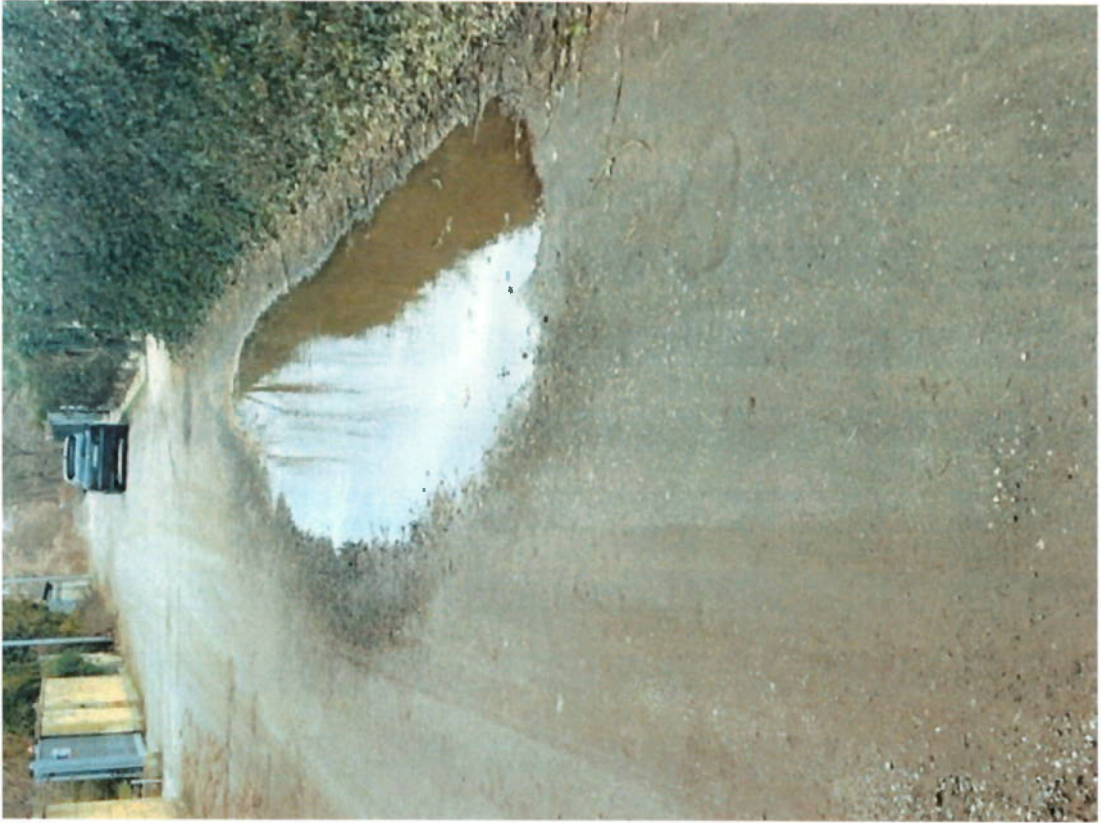
C1 - Internal use