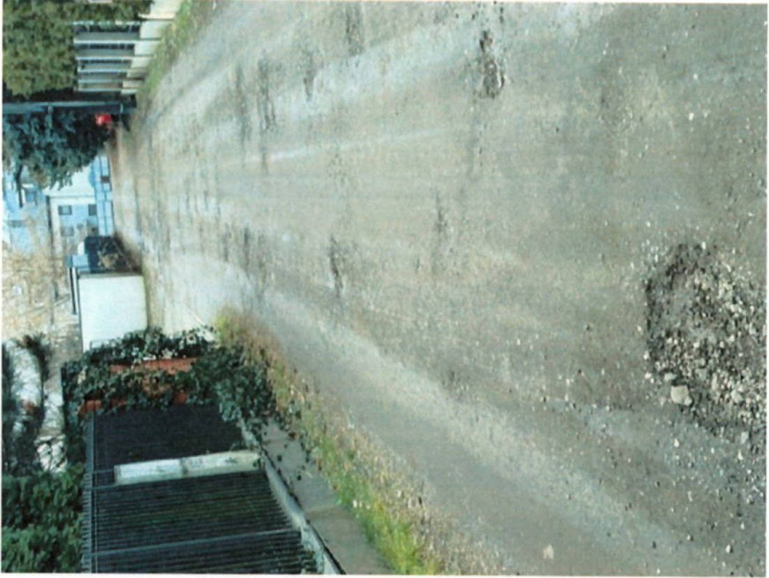
C1 - Internal use