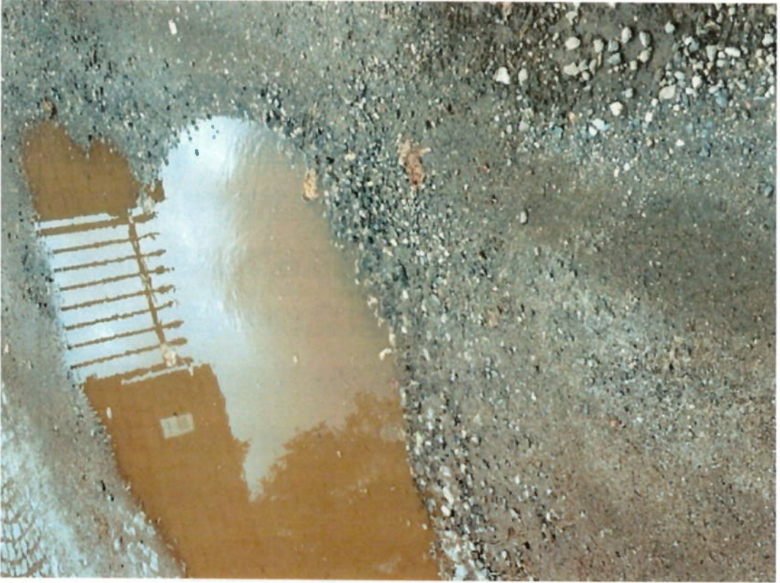
C1 - Internal use