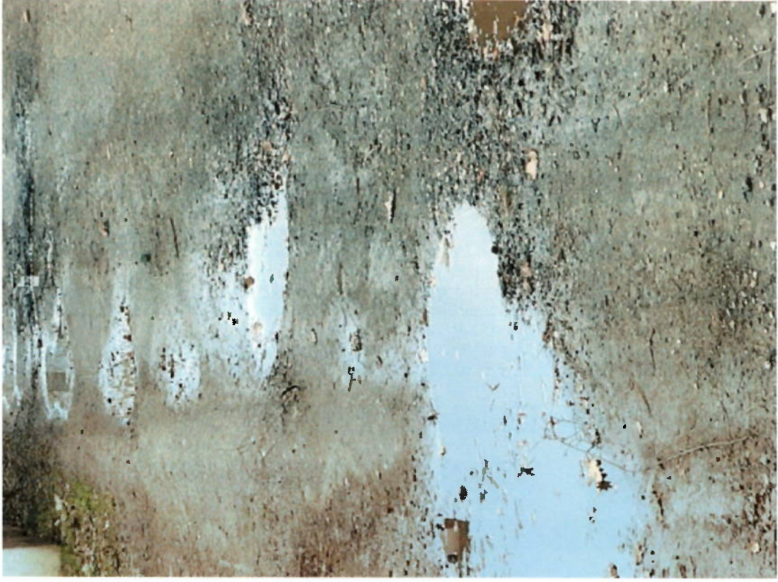
C1 - Internal use