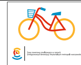
tablica 57,4 x 47cm