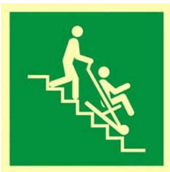
OZNACZENIE MIEJSCA Z KRZESŁEM EWAKUACYJNYM