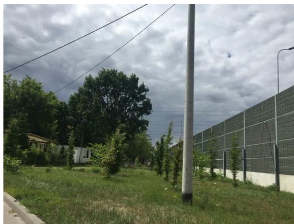
Fot. 6 Ekrany akustyczne przy drodze krajowej nr 7 – widok od ul. Glinianki

Wewnątrz obszaru opracowania nie planuje się trasowania nowych dróg publicznych do obsługi tego obszaru poza jedną drogą wewnętrzną w obszarze U1. Konieczne jest natomiast doprowadzenie klas dróg do zgodności ze Studium.