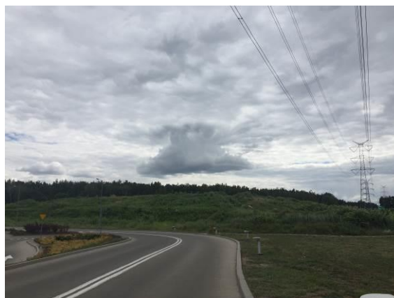
Fot. 2 Hałda po wysypisku odpadów oraz linia wysokiego napięcia

Obszar opracowania położony jest w strefie zurbanizowanej gminy. Stan przekształcenia antropogenicznego środowiska jest wysoki. Tereny zabudowane skupione są w pierzejach ulic Brukowej i Pancerz. Zabudowa położona w rejonie ulicy Pancerz jest zabudową mieszaną mieszkaniowo – usługową. Stan techniczny istniejącej tu zabudowy oraz jej forma architektoniczna są silnie zróżnicowane. Inny sposób zagospodarowania terenów występuje w rejonie ulicy Brukowej. Sposób zagospodarowania tego rejonu opracowania związany jest z funkcjonowaniem centrum