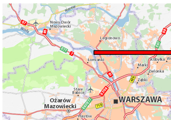
Ryc.4 Fragment mapy topograficznej z lokalizacją miasta Łomianki na tle regionu

Tereny niezabudowane w obszarze opracowania obejmują tereny położone pomiędzy drogą krajową S7 i zespołami zabudowy opisanymi powyżej. Tereny niezabudowane to przede wszystkim nieużytki rolnicze, w znacznej części zadrzewione. Mniejszą powierzchnię zajmują w tej kategorii grunty leśne. Największy kompleks leśny położony w pobliżu południowej granicy opracowania przy ulicy Pancerz.