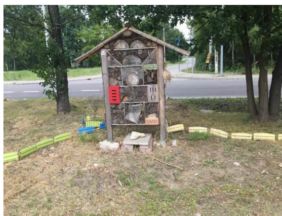
Fot. 4 Hotel dla owadów przy Centrum Handlowym Auchan