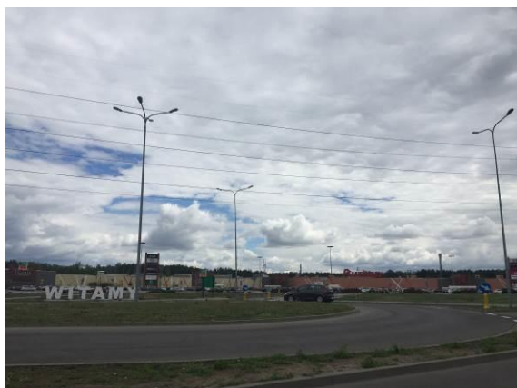
Fot.1 Widok na Centrum Handlowe Auchan z ul. Brukowej

Gmina położona jest pod względem fizycznogeograficznym w makroregionie Nizina Środkowomazowiecka, w mezoregionie Kotlina Warszawska. Kotlina Warszawska obejmuje rozszerzenie doliny Wisły poniżej Warszawy u zbiegu dolin środkowej Wisły, Narwi, Bugu i Bzury. W jej obrębie zaznaczają się dwa typy krajobrazu: tarasów zalewowych, przeważnie łąkowo-rolny oraz nadzalewowych tarasów piaszczystych z wydłami, przeważnie zalesiony.