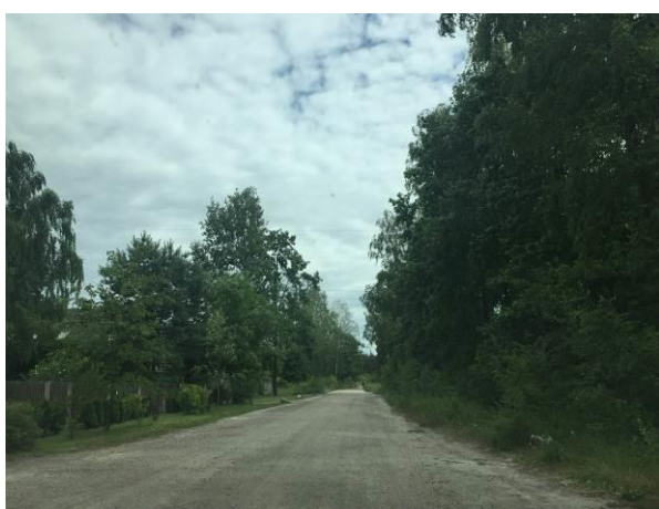
Fot.5 Gruntowa droga – ul. Stary Tor

W granicach obszaru objętego projektem planu znajduje się fragment wspomnianej drogi krajowej nr 7 oraz drogi publiczne, istotne dla funkcjonowania układu drogowego Łomianek: ul. Brukowa – droga klasy zbiorczej stanowiąca alternatywny dojazd do Warszawy a także Izabelina, ul. Stary Tor-droga klasy lokalnej, ul. Pancerz – droga klasy dojazdowej, oraz inne drogi dojazdowe.