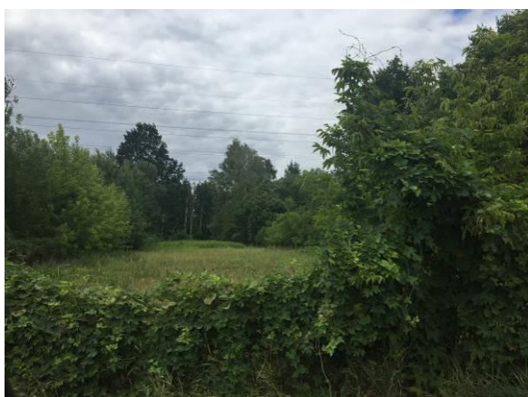
Fot. 3 Niezagospodarowana działka z zadrzewieniami – widok z ul. Stary Tor

Obszar opracowania nie był objęty szczegółowymi badaniami faunistycznymi. W literaturze nie ma wskazań na możliwość występowania w omawianym obszarze stanowisk zwierząt chronionych. Gatunki zwierząt występujące tu to przede wszystkim zwierzęta pospolicie występujące w obszarach zurbanizowanych. Ciekawym i zasługującym na uwagę obiektem jest hotel dla owadów znajdujący się przy Centrum Handlowym Auchan przy wylocie z ul. Glinianki