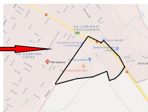
Ryc.5 Fragment mapy z lokalizacją obszaru projektu planu na tle miasta Łomianki

Krajobraz w tej części miasta jest mocno przekształcony. Silnym, dominującym i wyróżniającym się elementem są linie wysokiego napięcia oraz nawierzchnie utwardzone.