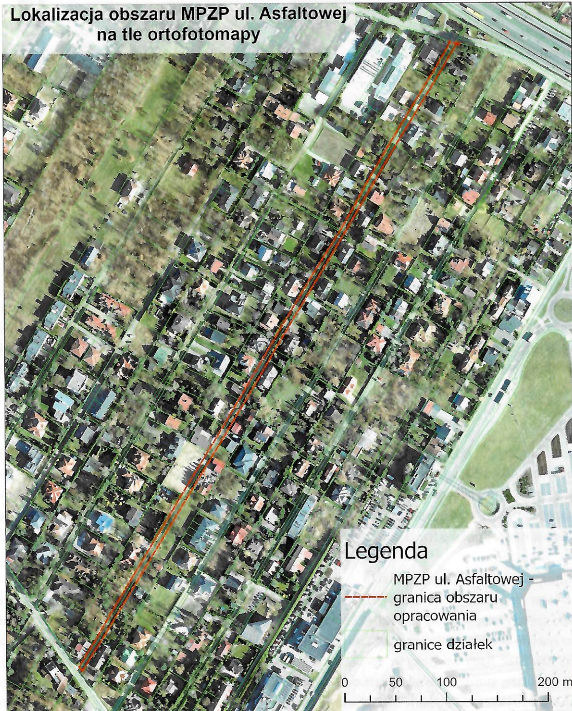
Rys. 1. Lokalizacja obszaru, dla którego trwa sporządzanie projektu miejscowego planu zagospodarowania przestrzennego

Teren analizy podlega regulacjom miejscowego planu zagospodarowania przestrzennego obszaru osiedla Dąbrowa Leśna – etap II, Uchwała Nr XXXIV/406/2017 Rady Miejskiej w Łomiankach z dnia 26 października 2017 r.: