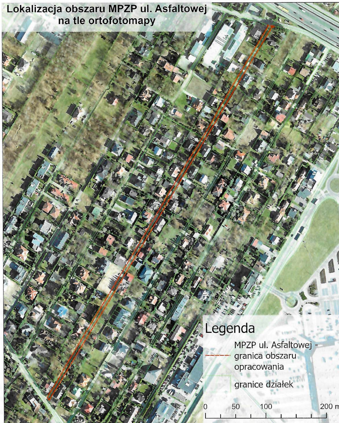
Rys. 1. Lokalizacja obszaru, dla którego trwa sporządzanie projektu miejscowego planu zagospodarowania przestrzennego

Teren analizy podlega regulacjom miejscowego planu zagospodarowania przestrzennego obszaru osiedla Dąbrowa Leśna – etap II, Uchwała Nr XXXIV/406/2017 Rady Miejskiej w Łomiankach z dnia 26 października 2017 r.: