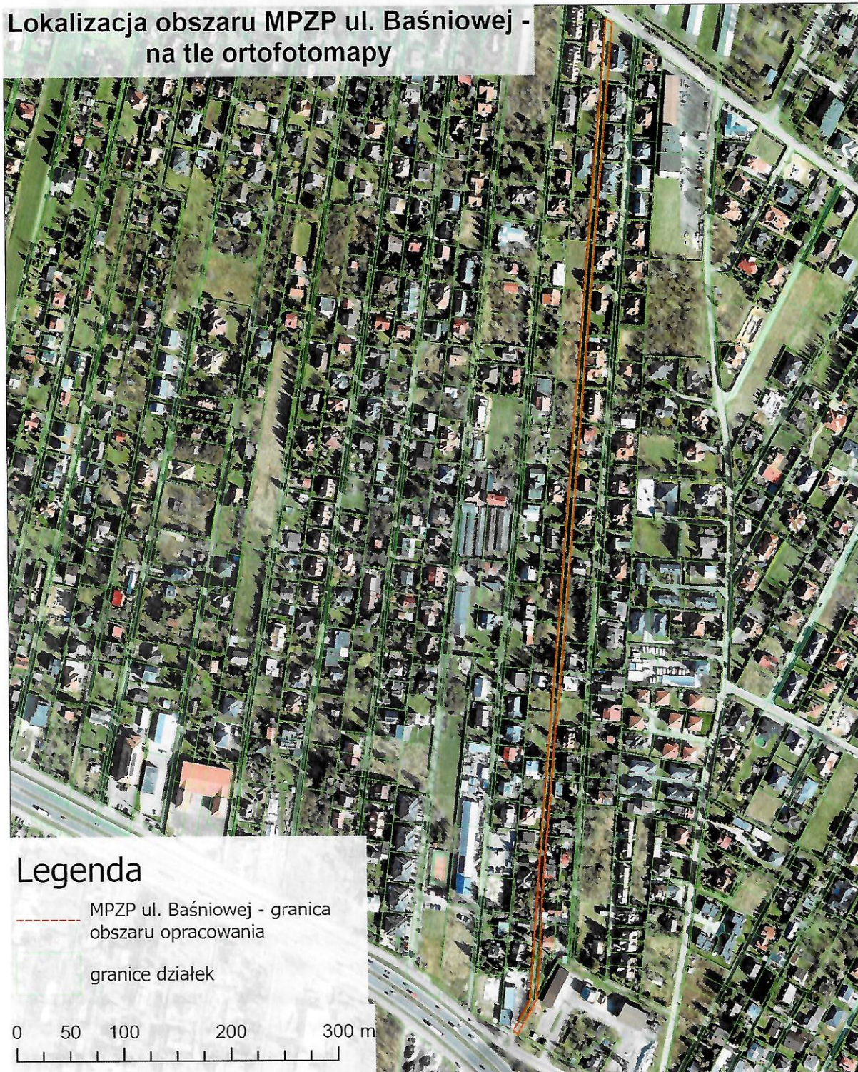
Rys. 1. Lokalizacja obszaru, dla którego trwa sporządzanie projektu miejscowego planu zagospodarowania przestrzennego

Teren analizy podlega regulacjom miejscowego planu zagospodarowania przestrzennego obszaru części sołectwa Dziekanów Bajkowy oraz części sołectwa Dziekanów Leśny, Uchwała Nr XXXIV/405/2017 Rady Miejskiej w Łomiankach z dnia 26 października 2017 r.: