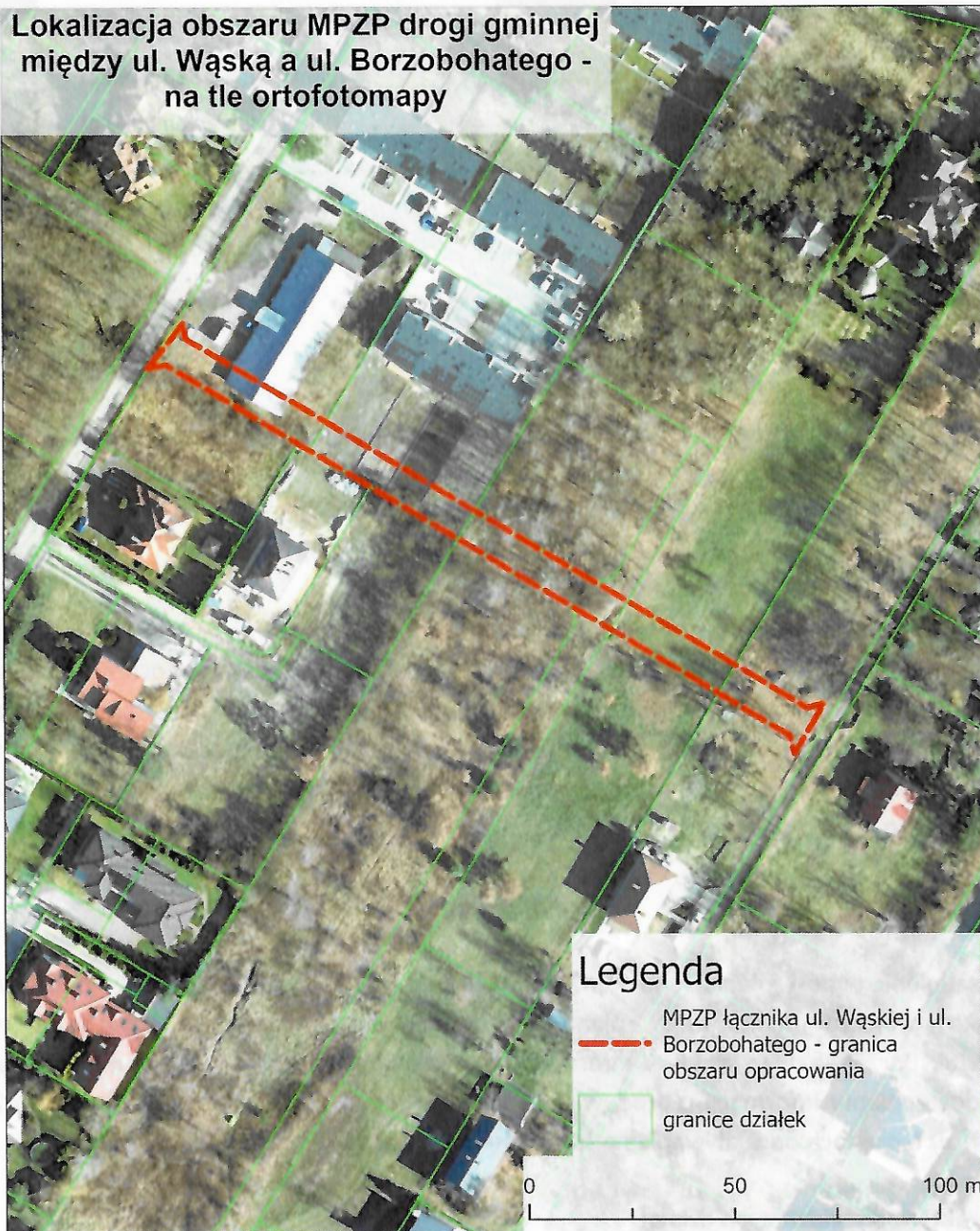
Rys. 1. Lokalizacja obszaru, dla którego trwa sporządzanie projektu miejscowego planu zagospodarowania przestrzennego

Teren analizy podlega regulacjom miejscowego planu zagospodarowania przestrzennego obszaru osiedla Dąbrowa Leśna – etap II, Uchwała Nr XXXIV/406/2017 Rady Miejskiej w Łomiankach z dnia 26 października 2017 r.: