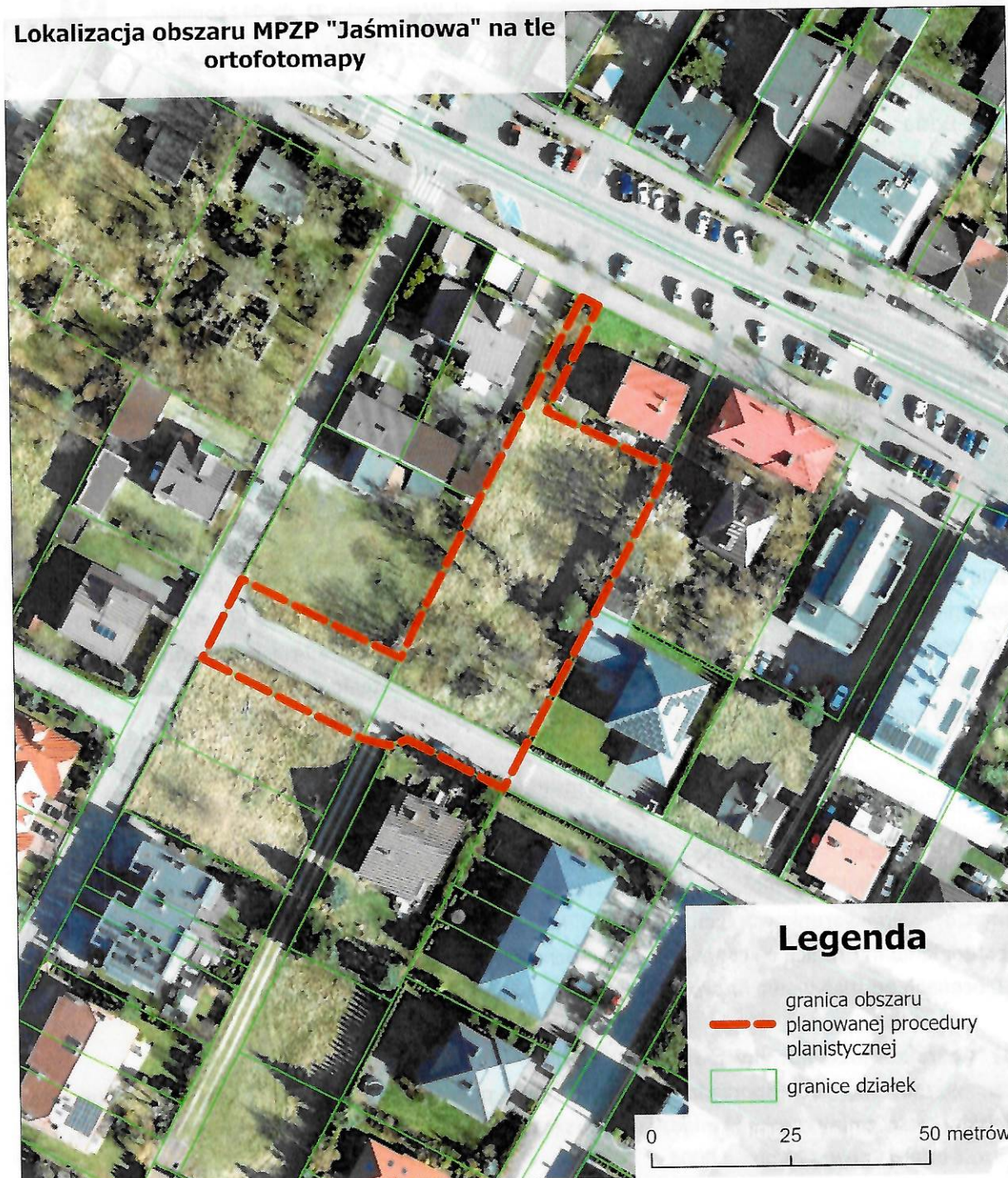
Rys. 1. Lokalizacja obszaru, dla którego trwa sporządzanie projektu miejscowego planu zagospodarowania przestrzennego

Analizowany obszar położony jest w granicach miejscowego planu zagospodarowania przestrzennego „Łomianki Centrum” – Uchwała Nr LV/414/2010 z 4 listopada 2010 r.. Zgodnie z planem, w obszarze opracowania obok pasa drogowego ul. Jaśminowej znajduje się teren przeznaczony pod zabudowę usługową i/lub mieszkaniową jednorodziną śródmiejską – teren oznaczony symbolem 4U/MN4. Zgodnie z ww. planem, na przedmiotowym terenie – w zakresie w jakim nie stanowi pasa drogowego - funkcjonują obecnie następujące ustalenia szczegółowe planu: